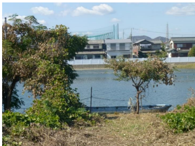
対岸は濱田村、今も船が舫う着岸地