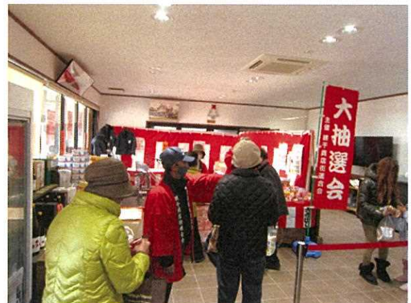
網干商店街連合会 大感謝祭抽選会