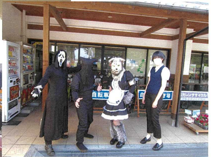
サブカルイベント