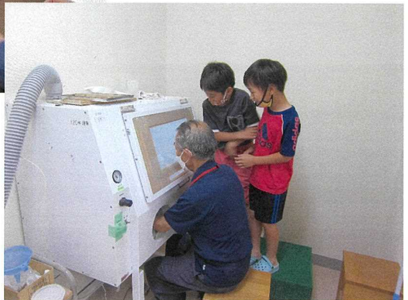
ガラス工房体験教室