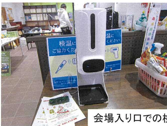
会場入り口での検温とアルコール消毒