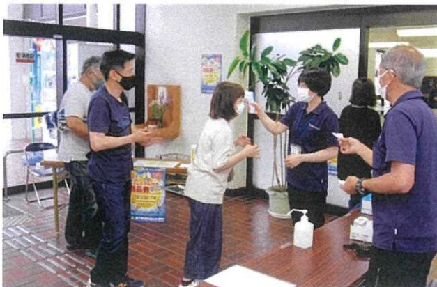
網干市民センター