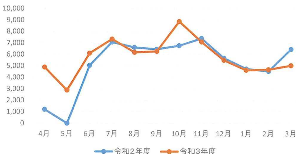
網干市民センター来館者数

令和2年1月下旬からの新型コロナウイルスとの付き合いも足掛け3年となり、徹底したウィルス対策が我々に課された最重要課題です。少しでも市民の方々の不安を取り除いて、施設をご利用いただく事を念頭において、今年度もあぼしまち交流館、網干環境楽習センター、そして市内の各市民センターや各公民館との情報共有をしながら、地元をはじめ市民の皆様の安全、安心の交流の場となるよう運営管理をしていきたいと思っています。