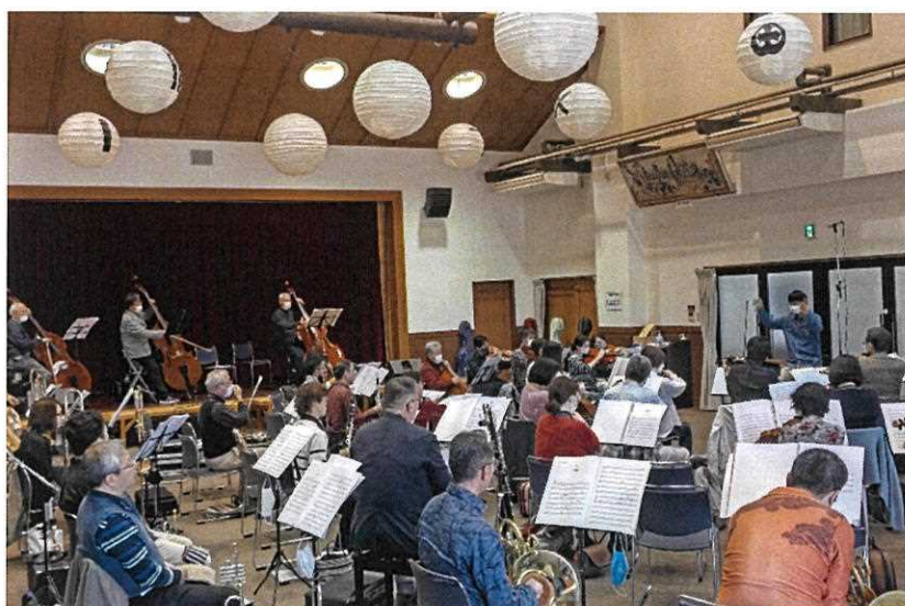
姫路交響楽団 練習