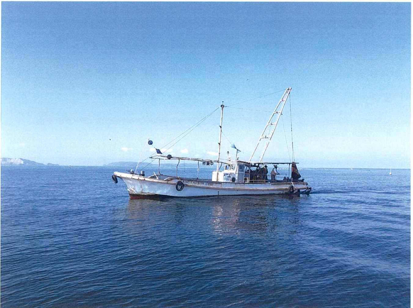
令和3年8月海洋ごみ採集

2008年12月の設立以来、稀にみる試練がやってきました。令和元年度終わりに新型コロナウイルスのまん延拡大を経験して、4回の緊急事態措置発令、そして同じく4回のまん延防止措置発令と足掛け3年の間、新型コロナと向き合うこととなりました。当団体も少なからずその影響を受けましたが、そのコロナ禍の中で実施できた事業を報告します。