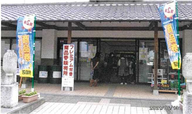
あぼしまち交流館