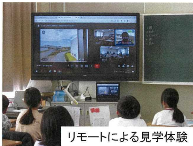
リモートによる見学体験