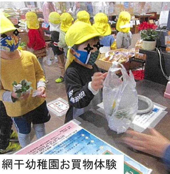
網干幼稚園お買物体験