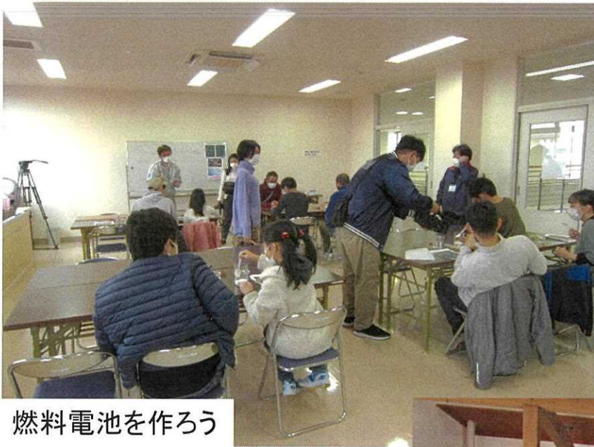
燃料電池を作ろう